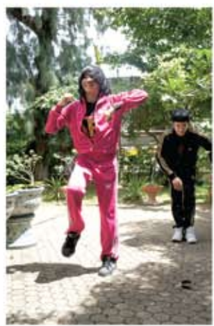
อันดับที่ 2 สุตาวัลย์