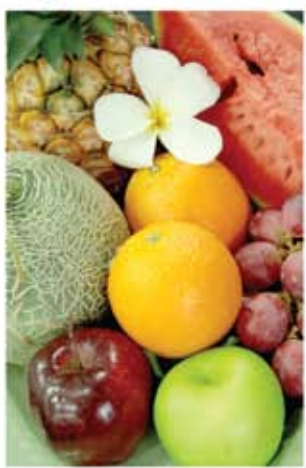
อันดับที่ 1 แว