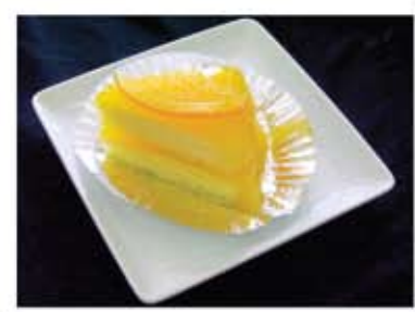
อันดับที่ 3 นรงค์